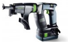
Akumulatorinis suktuvas gipso kartono plokštėms DWC 18-2500 5,2 Li-Plus Užsakymo nr.: 564590