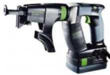
Akumulatorinis suktuvas gipso kartono plokštėms DWC 18-4500-Plus Užsakymo nr.: 564592