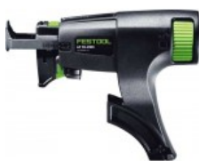
AF 55-DWC Užsakymo nr.: 769146