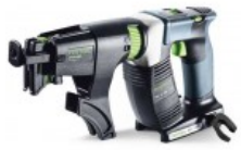
Akumulatorinis suktuvas gipso kartono plokštėms DWC 18-4500 Li-Basic Užsakymo nr.: 564608