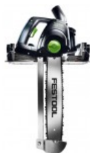
Grandininis pjūklas IS 330 EB Užsakymo nr.: 767998

Visą sąrašą priedų, reikmenų ir susijusių įrankių rasite www.festool.lt puslapyje