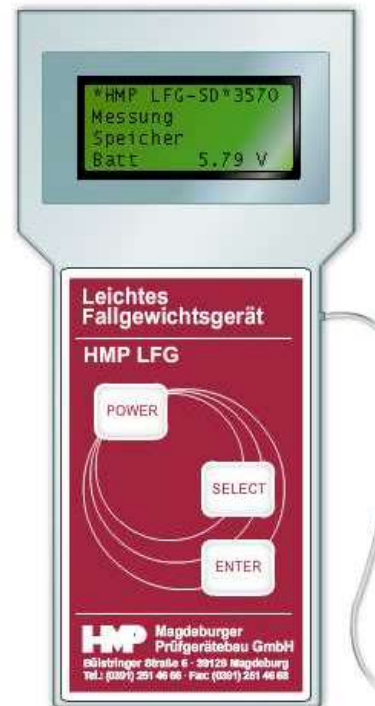
Elektroninis matavimo prietaisas HMP LFG-SD